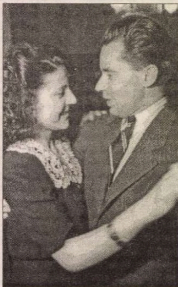
O vitalitate seducătoare.